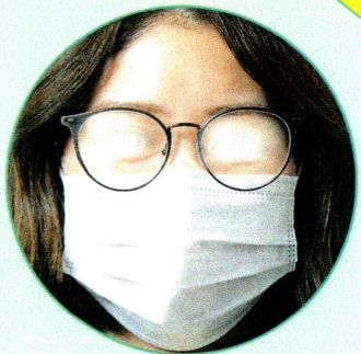
曇るレンズ ※HOYAVPコートレンズ