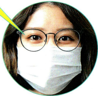
くもりにくいレンズ ※使用環境や状況によってくもることがあります。

「KUMORI 291」コートは、メンテナンスフリーのくもりにくいレンズです。レンズ両面のくもりを抑制する特殊なコーティングにより、優れたくもり低減性能を発揮します。表面の拭き取りやすさも特長です。