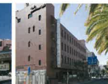
高知メディカルプラザ 徒歩1分(5m)