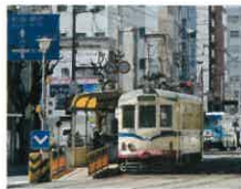
とぎでん交通「潮話」電停 徒歩5分(340m)

暮らし自在な生活エリア。都心という環境が貴方の日々の、かつてない潤いと利便性を与えます。