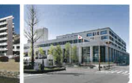
高知市役所 徒歩9分(720m)