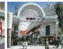
帯屋町商店街 徒歩2分(160m)