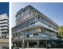
オーネピア高知図書館 徒歩1分(80m)