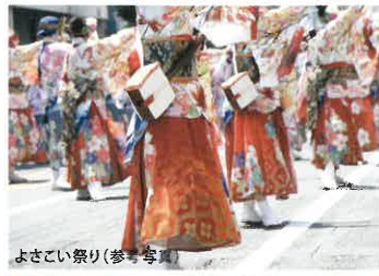
よさこい祭り(参考写真)

毎年8月に開催される高知の夏の最大イベント「よさこい祭り」。ここ追手筋は、その競演場の中心となって祭り一色に染まります。高知人の文化が息づくイベントが暮らしの中に…。これもこの住まいの誇りです。