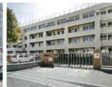
高知市立はりまや橋小学校 徒歩10分(750m)