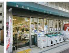
毎日屋大橋通り店 徒歩5分(350m)