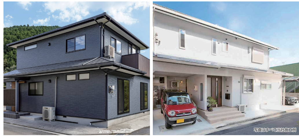
写真はすべて当社施工例

組合員様特典 一律 本体工事金額(税抜)の 3%OFF ※建物診断前に生協組合員証のご提示が必要です。 ※他のキャンペーンとの併用は不可とさせていただきます。※詳しくはお尋ねください。