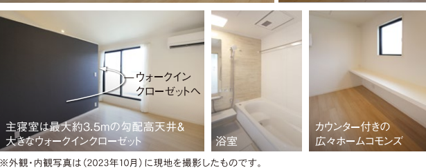
※外観・内観写真は(2023年10月)に現地を撮影したものです。