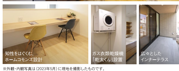
※外観・内観写真は(2023年5月)に現地を撮影したものです。