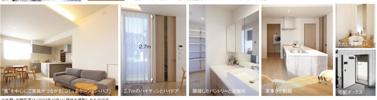
※外観・内観写真は(2023年10月)に現地を撮影したものです。