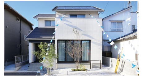
※建物外観は、5号地を撮影(2023年10月)。