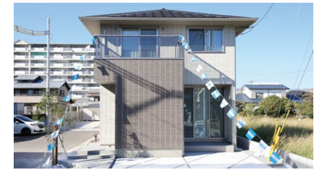
※建物外観は、現地を撮影(2023年10月)。