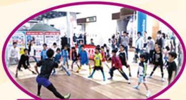
専門家によるレッスン